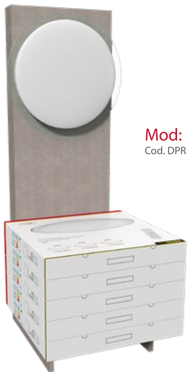
Mod: Boston Cod. DPR150 + LV55