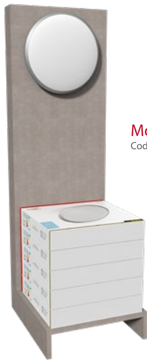
Mod: Huston Cod. DPR150 + LY38N