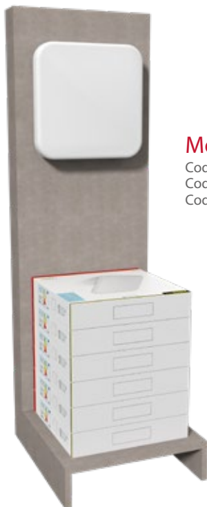
Mod: Denver Cod. DPR150 + LQ28N Cod. DPR150 + LQ33N Cod. DPR150 + LQ38N