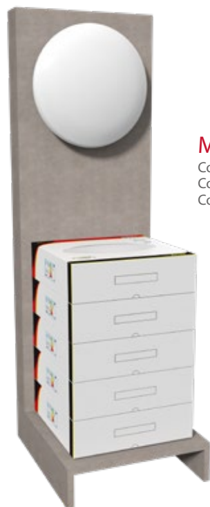
Mod: Austin Cod. DPR150 + LC60N Cod. DPR150 + LC90N Cod. DPR150 + LC120N