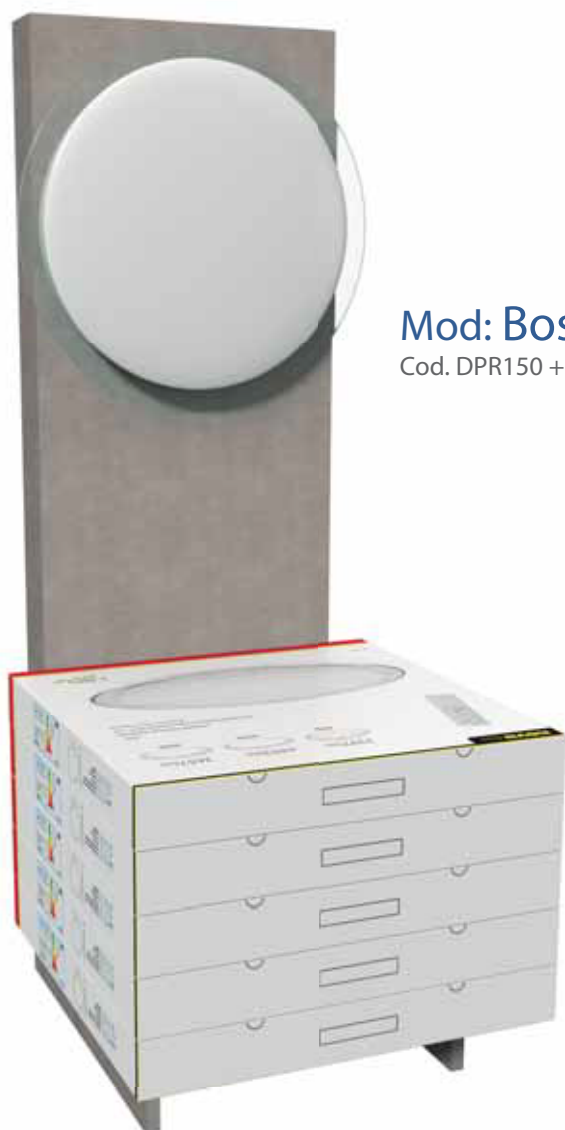
Mod: Boston Cod. DPR150 + LV55