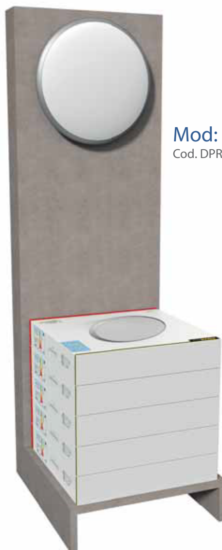
Mod: Huston Cod. DPR150 + LY38N